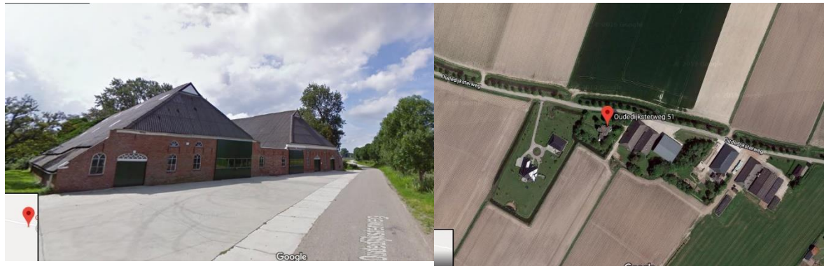
Foto en luchtfoto huidige situatie

Het gaat om een karakteristieke boerderij (akkerbouwbedrijf). Het is karakteristiek vanwege de ligging, tuinaanleg en opzet. De schuren zijn in de 19 e eeuw in traditionele stijl gebouwd. Het woonhuis uit 1912 heeft een sobere art nouveau stijl. Sinds de bouw van het woonhuis is er geen sprake meer van een traditionele kop-hals-rompboerderij. De boerderij kenmerkt zich door de naar de weg gekeerde schuurgevels.