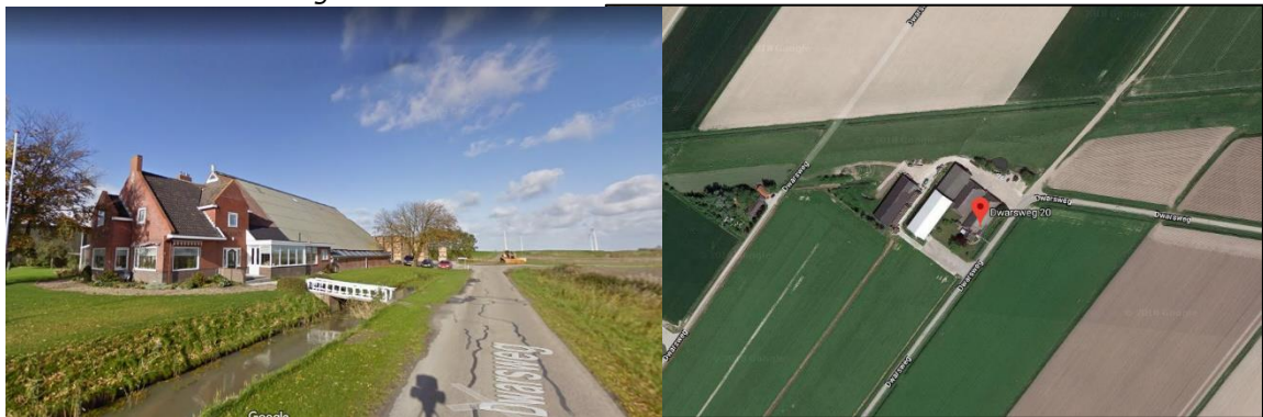
Foto en luchtfoto huidige situatie

De boerderij (akkerbouwbedrijf) is niet aangewezen als een karakteristiek pand. De eigenaren hebben onvoldoende ruimte voor de opslag van producten en hebben de wens om wonen en werken te scheiden. Uitbreiding is moeilijk vanwege de dijk die de natuurlijke grens van het bouwperceel vormt en het geldende bestemmingsplan uitbreiding in andere richtingen niet toestaat.